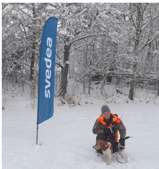
Arrak före släpp dag 2

Dag 2, tisdag 22 november , hade temperaturen stigit och tangerade 0-strecket uppåt dagen. Snön var dock fortfarande ganska torr, speciellt under första halvan av provdagen. Frågan var ju nu om trion i täten skulle hålla undan för övriga konkurrenter?