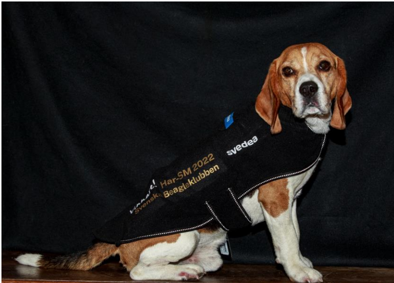
Vilagårdens Arrak, värdig vinnare!